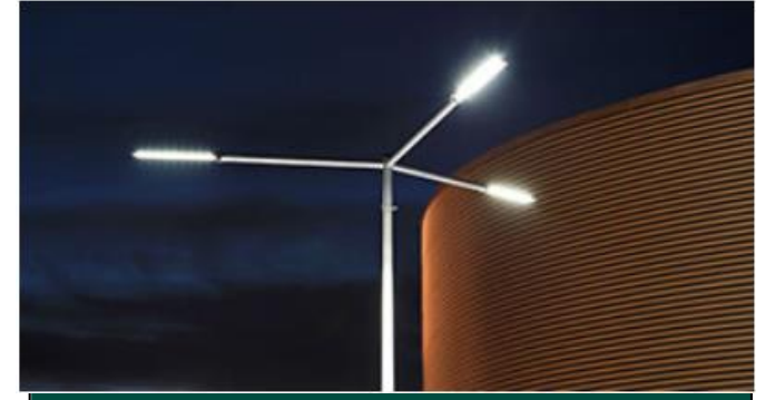
EFFICIENTAMENTO IMPIANTO DI ILLUMINAZIONE ESTERNA