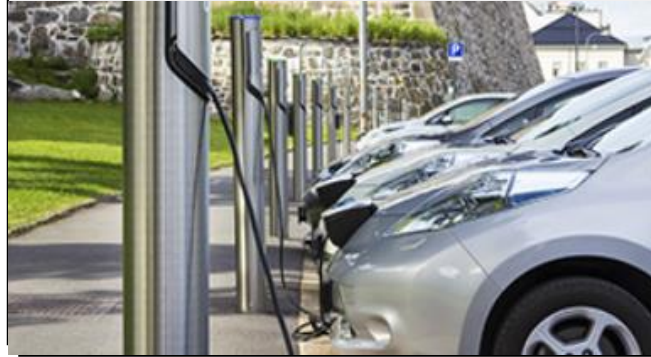
ACQUISTO FLOTTE AZIENDALI ELETTRICHE