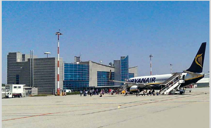
L'aeroporto di Levaldigi è salvo, grazie all'ingresso in GEAC del nuovo socio Levaldigi Holding. (articolo a pagina 10)