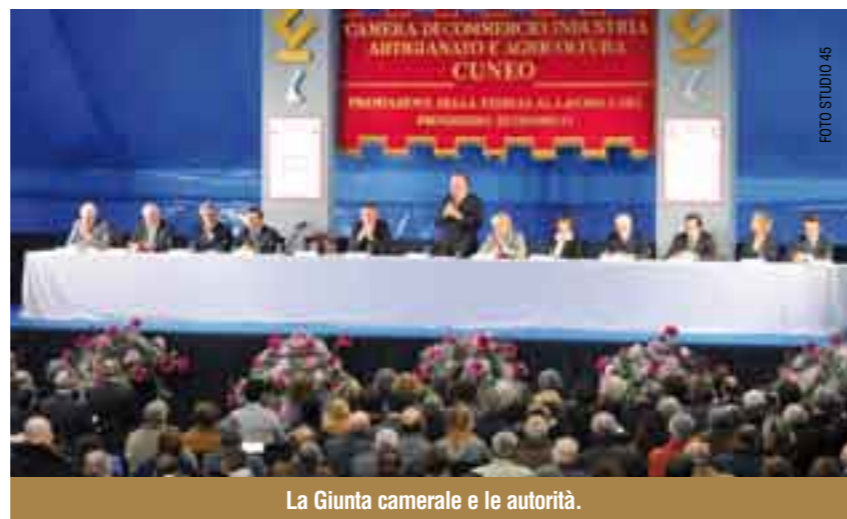
La Giunta camerale e le autorità.